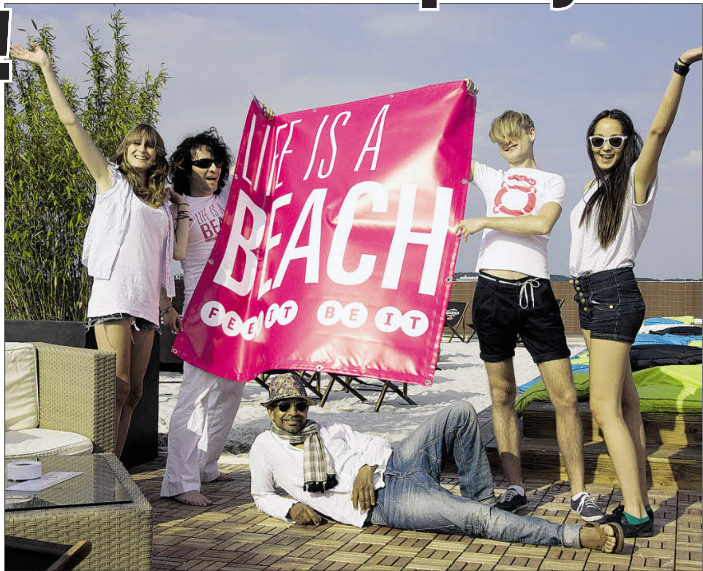
Fotos links und oben: Der Citystrand am Wehrhahn lädt Beachbabes und Sunnyboys zum Partyvideo-Dreh.